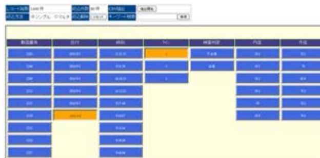
図4. BUI モジュールによる元データ絞り込み表示イメージ ※データはサンプルです (ボタンを押す度に該当データが順次絞り込まれる)