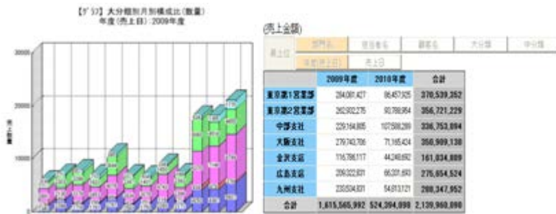
図3. DataNature/Eによる表示イメージ ※データはサンプルです (左：在庫数量の月別推移グラフ、右：ドリルダウン分析可能な集計表)